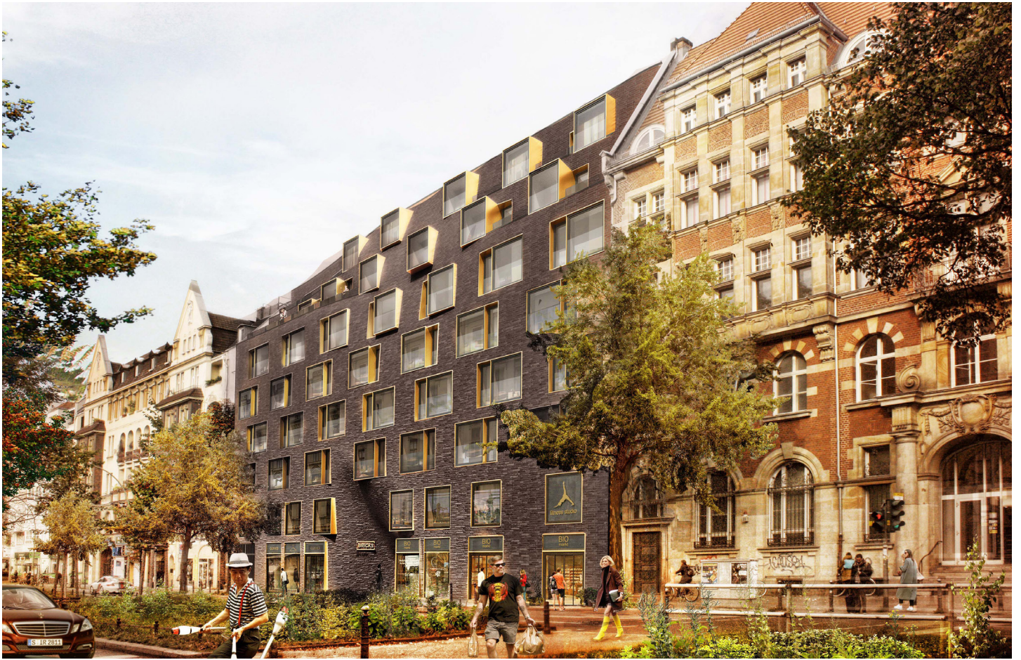
Ausdrucksvolle Backsteinfassade zur Hauptstrasse Expressive brick facade at Hauptstrasse