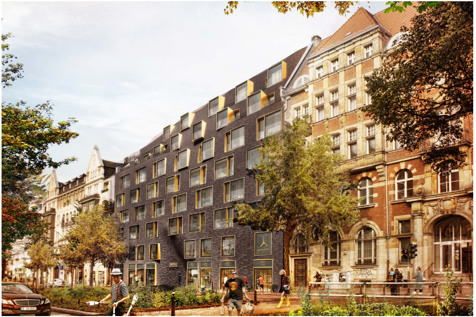
Ausdrucksvolle Backsteinfassade zur Hauptstrasse