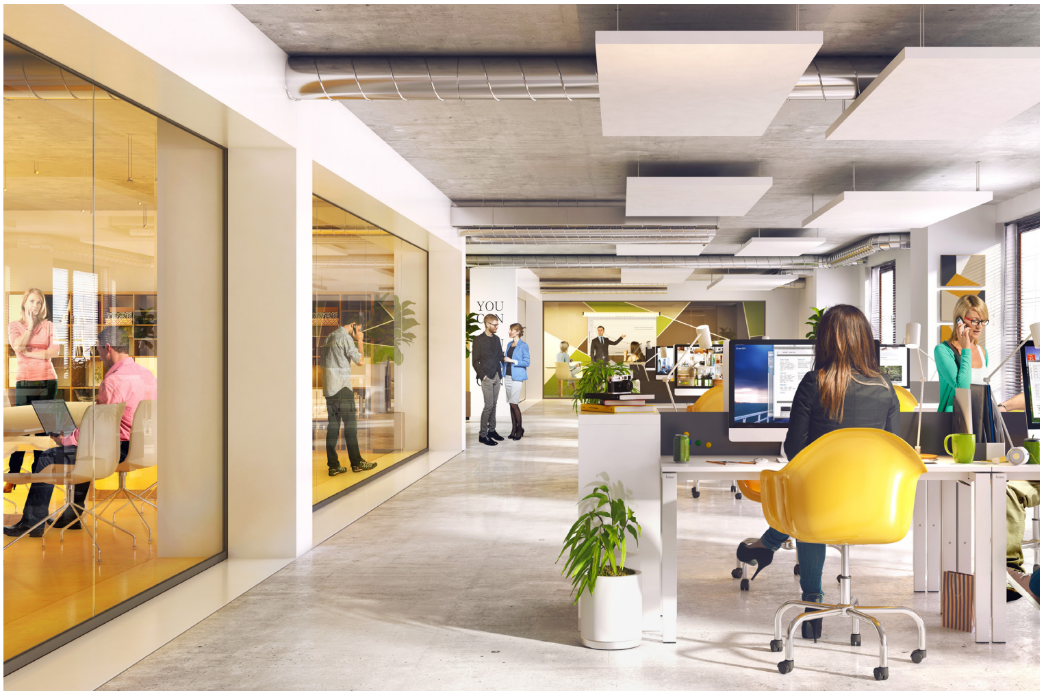
Hochmoderne und flexible Büroflächen